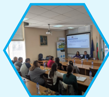
Byala Slatina, Bułgaria