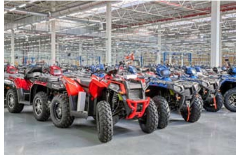
Fot. Opole jest pierwszym poza Ameryką Północną miejscem, w którym produkowane są pojazdy terenowe, w tym quady, skutery śnieżne, motocykle jak również elektryczne i hybrydowe pojazdy drogowe firmy Polaris.