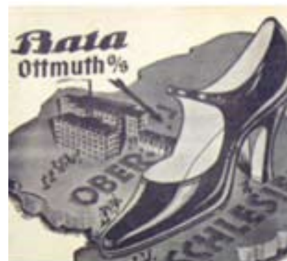
Fot. Archiwalne reklamy: zakładów obuwniczych Bata w Otmęcie i karetek „Nysa”.

Unikalną cechą kultury przemysłowej jest też pozytywny emocjonalny związek z produktami, które były, są i będą wytwarzane w regionie. Dotyczy to w szczególności dóbr konsumpcyjnych, takich jak niegdyś buty i samochody, a dzisiaj luksusowe meble, wyposażenie wnętrz czy quady.