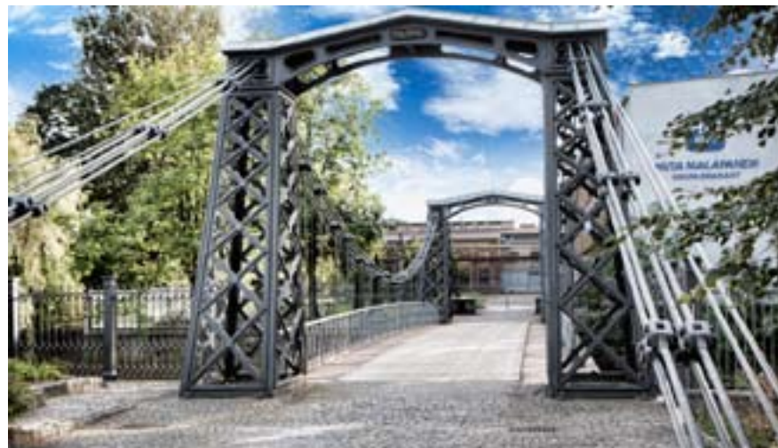
Fot. Most żeliwny w Ozimku jest pomnikiem historii architektury. Wybudowany w 1827 roku jest najstarszym w Europie kontynentalnej żelaznym mostem wiszącym.